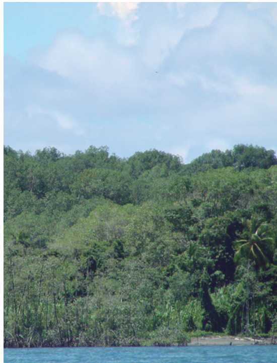
Figura 4. Fotografía costera de un sector de Buenaventura con la presencia de manglares, palmares, helechales y bosque densos altos de tierra firme.