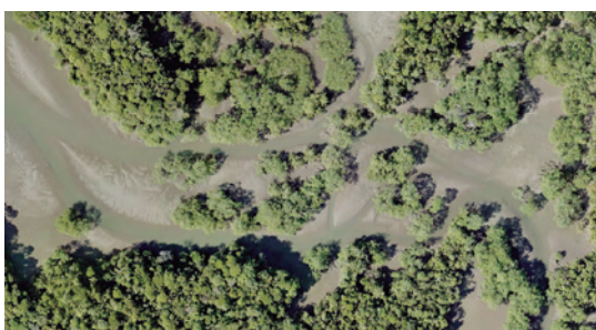
Figura 3. Vegetación costera de un sector de Punta Soldado con la presencia de manglar denso bajo y manglar denso alto (arriba). Ortofotografía correspondiente a la vegetación manglar abiertos alto.