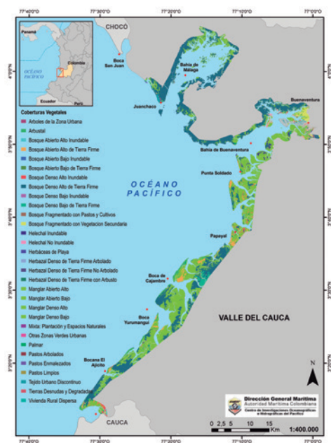
Figura 2. Mapa de las coberturas vegetales de la franja costera del valle del cauca.