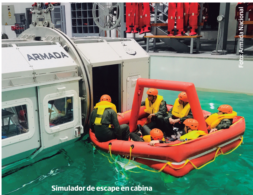
Simulador de escape en cabina