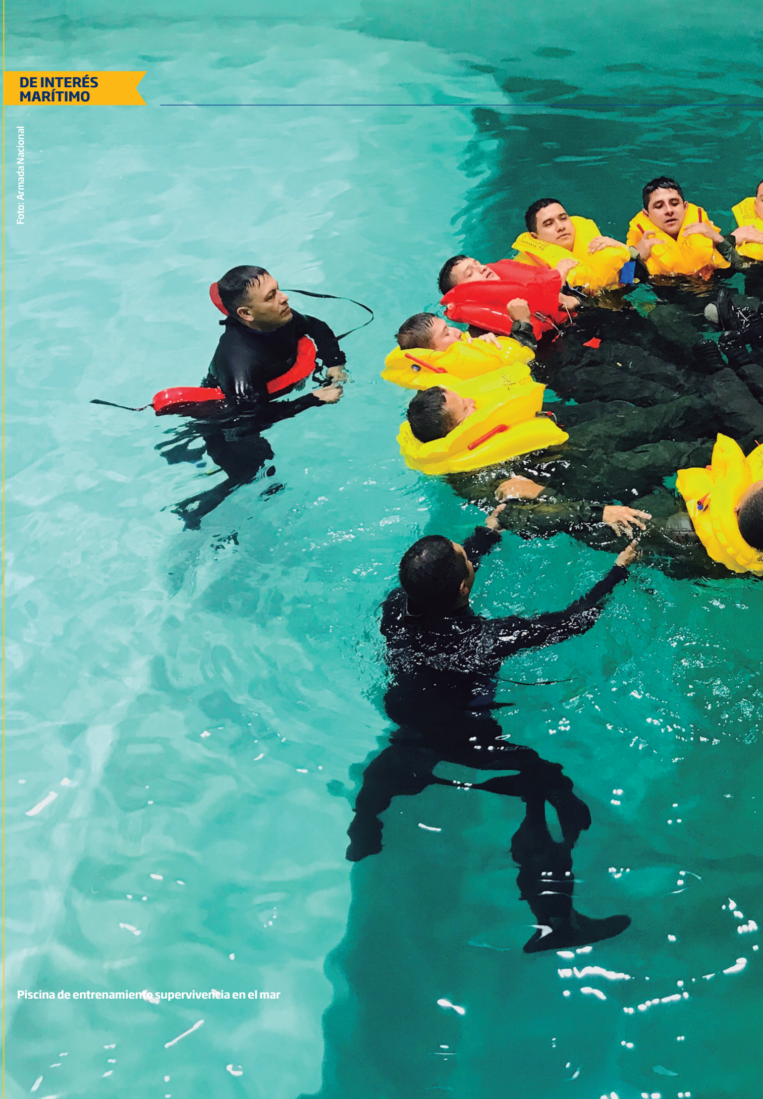
Piscina de entrenamiento supervivencia en el mar