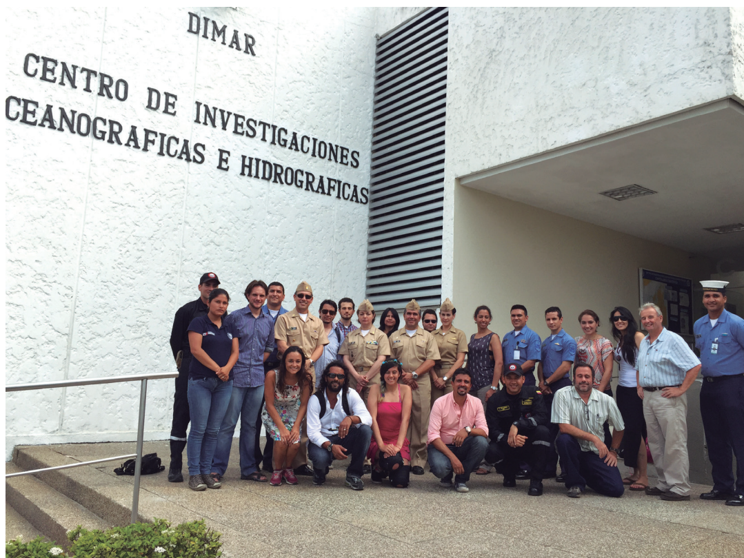
Figura 3. Curso Internacional en Patrimonio Cultural Sumergido de 2015, en conjunto entre la Organización de las Naciones Unidas para la Educación, la Ciencia y la Cultura (Unesco), la Dimar, la Universidad del Externado, la Escuela de Buceo y Salvamento, y la Fundación Terra firme.

sumergido. Es así que, investigadores de la Dimar se encuentran desarrollando un protocolo de gestión y monitoreo sobre el patrimonio cultural sumergido, a partir de la caracterización y evaluación de variables naturales y oceanográficas. Surge la necesidad de establecer estrategias de monitoreo y seguimiento que permitan caracterizar los efectos de los factores naturales y antrópicos sobre el estado de los pecios, y a su vez proponer estrategias para su protección y conservación