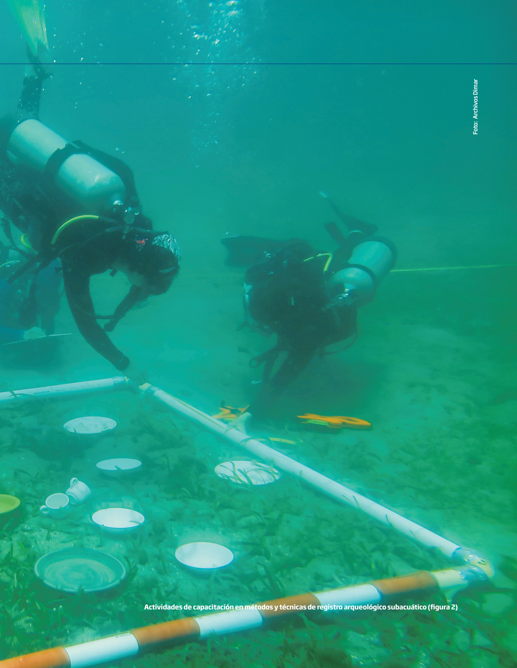
Actividades de capacitación en métodos y técnicas de registro arqueológico subacuático (figura 2)