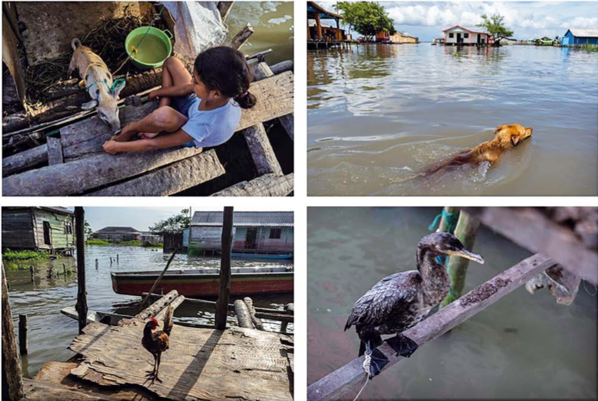
Figura 3. Fotografías de adaptaciones de prácticas agropecuarias al medio acuático.

trabajo para la agricultura (hacha, pala y azadón o palo cavador) no se observan con frecuencia en Nueva Venecia; por el contrario, la canoa, el canaleta, la atarraya o los anzuelos son comunes en todas las casas visitadas.