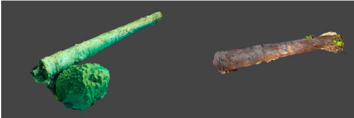
Figura 2. Fotogrametría de los cañones del Fuerte Brooke.

zona intermareal y el otro sumergido que podrían corresponder con la batería de San Salvador. Estas tres fortificaciones se encontraban en la isla de Santa Catalina, la primera teniendo como función principal la protección de la bahía y el asentamiento; las dos últimas posiblemente tenían una función de vigilancia y control para alertar a las demás fortificaciones de presencia enemiga (figuras 1 y 2).