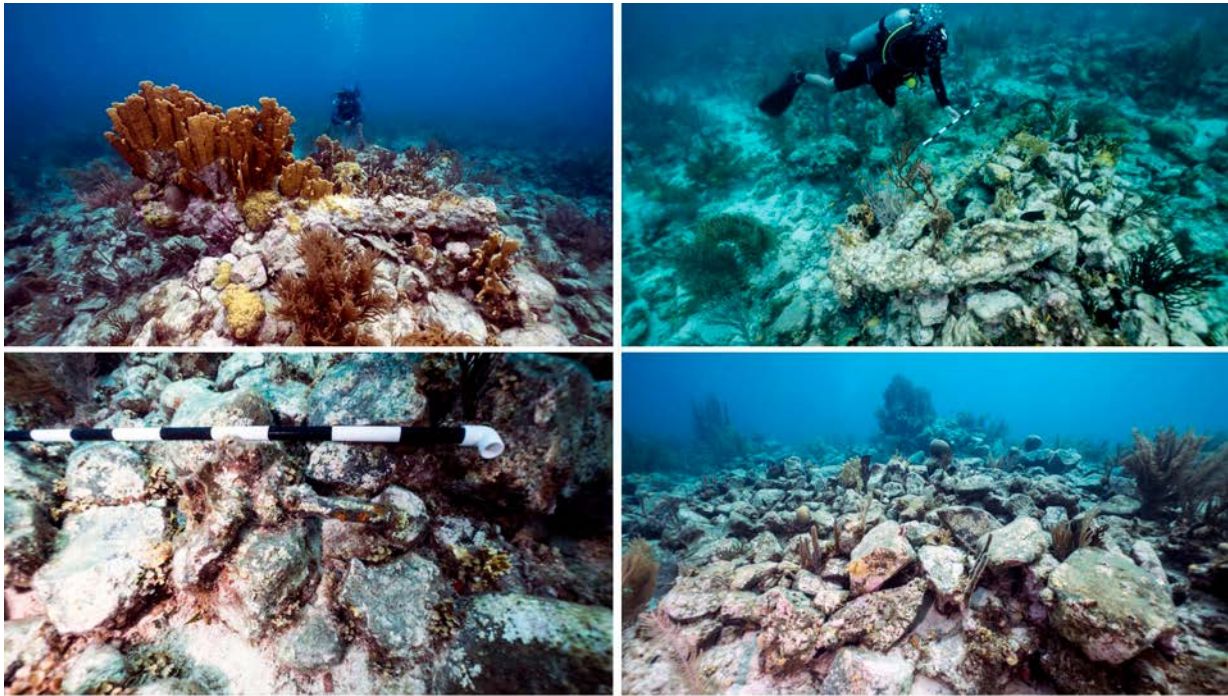
Figura 5. Fotografías del posible naufragio donde se observa un cañón, un ancla y la agrupación de lastre.

Estos elementos dan cuenta de la cantidad de interacciones que existían entre las islas del archipiélago con las demás islas del Caribe y el continente. Estas interacciones se desarrollaron como parte de las actividades de control gubernamental del territorio del imperio español, de los ingleses o incluso como parte de las actividades de piratas y corsarios. Así, a lo largo de los siglos se crearon fuertes vínculos con regiones como Cartagena de Indias (Colombia), Portobelo (Panamá) y Port Royal (Jamaica).