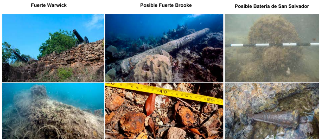
Figura 1. Elementos arqueológicos de las fortificaciones identificadas. (Fotos: Santiago Estrada, Fernando Cadena, Banco de Imágenes Dimar).

Desde el componente arqueológico de la investigación, los resultados fueron divididos entre los tres componentes de la investigación: movilidad, defensa y producción. A través de ello se vinculó la información histórica y la identificación de los sitios arqueológicos en campo. A nivel defensivo, en las islas los datos históricos muestran que por medio de las diferentes ocupaciones se construyeron varias fortificaciones para la protección de las diferentes zonas de las islas (Cummings, 2017). Así, a partir del análisis de las fuentes primarias se identificaron zonas de interés arqueológico que posteriormente fueron corroboradas en campo de manera no intrusiva.