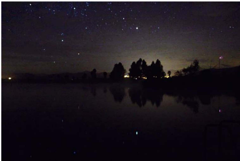
Figura 2. Reflejo de la bóveda celeste en la superficie del manantial.

único sitio en el que han sido localizados restos prehispánicos; además, es uno de los cuerpos de agua más cristalinos en todo el país, particularidad que permite observar desde la superficie el fondo, sumado a esto las aguas que lo componen son termales y cuando las condiciones atmosféricas lo permiten es posible observar vapor sobre su superficie. De forma complementaria, dadas las características que dan cuerpo al manantial, por las noches, cuando no hay corrientes de viento que muevan el agua y si el cielo se encuentra despejado, es posible ver el reflejo de la esfera celeste, esto es interesante pues el espejo estaba asociado con la profecía en el México antiguo (Figura 2). De esta manera se observan distintos elementos en el espacio del manantial que al ser percibidos por los grupos que frecuentaron el sitio, dan sentido al paisaje ritual que formularon para entablar conexiones con otras entidades y lugares.