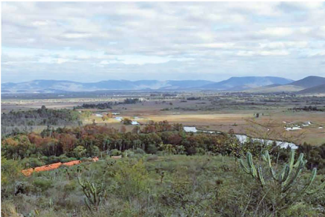
Figura 8. Vista del manantial La Media Luna desde el ascenso a la Loma 1 del cerro El Jabalí. (Foto: Roberto Ruiz).

Finalmente, siguiendo a Lara y Estrada (2020:39) respecto al simbolismo del paisaje ritual del manantial, quizás la facilidad de observar el fondo y su peculiar relieve tuvo como resultado la concepción de otro mundo, al cual se ingresaba o se tenía contacto a través del espejo de agua.