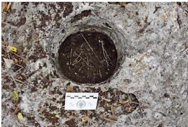
Figuras 4. Poza 3 (posible xicalli).