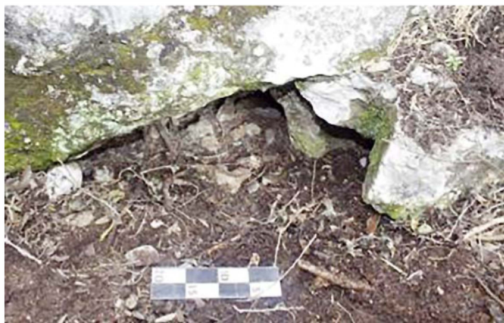
Figura 7. Vista desde enfrente del Respiradero 1 en la Loma 1 del Cerro El Jabalí.