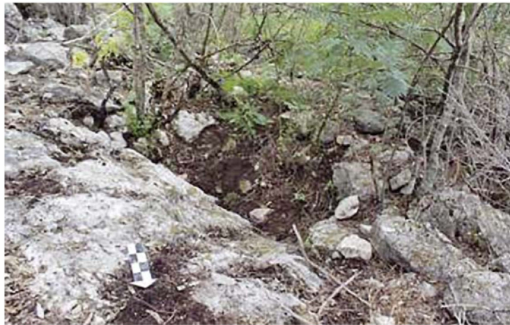
Figura 6. Vista general del área en donde se encuentra el respiradero 1 en la Loma 1 del cerro El Jabalí.