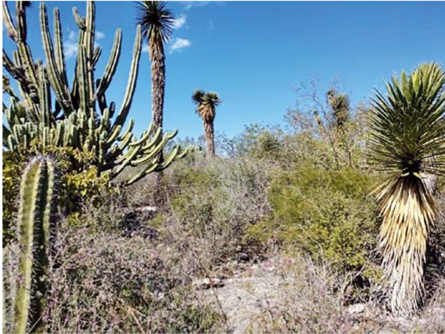
Figura 3. Vegetación en la Loma 2, misma que predomina en todo el cerro El Jabalí. (Foto: Roberto Ruiz).

mencionados se encuentra una oquedad desde la que brota aire que va de tibio a caliente, cuyas dimensiones aproximadas son 60 cm de largo, 50 cm de alto y se desconoce la profundidad que pudiera llegar a tener (figuras 6 y 7).