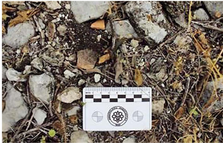
Figura 5. Tepalcates asociados a la Poza 1.