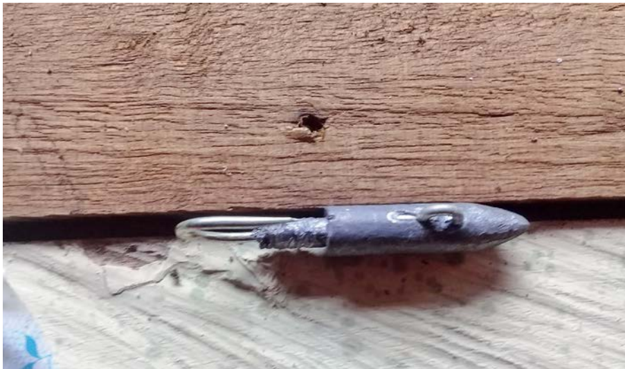
Figura 2. Un objeto para el engaño.

emanación a un engaño. La fabricación de estas cosas vivas, de estos objetos que adquieren vida, guardan un sinnúmero de conocimientos. Entre ellos están las cabezas, las rabonas y las plumas. Cada uno de estos objetos cumple una intención y se relaciona de manera distinta con el agua. Por ejemplo, las cabezas se hacen con plomo. Se cuece el plomo para luego verterlo en un tubo o formaleta del tamaño de la cabeza, el cual generalmente se hacen con el tallo que sostiene la hoja del papayo.