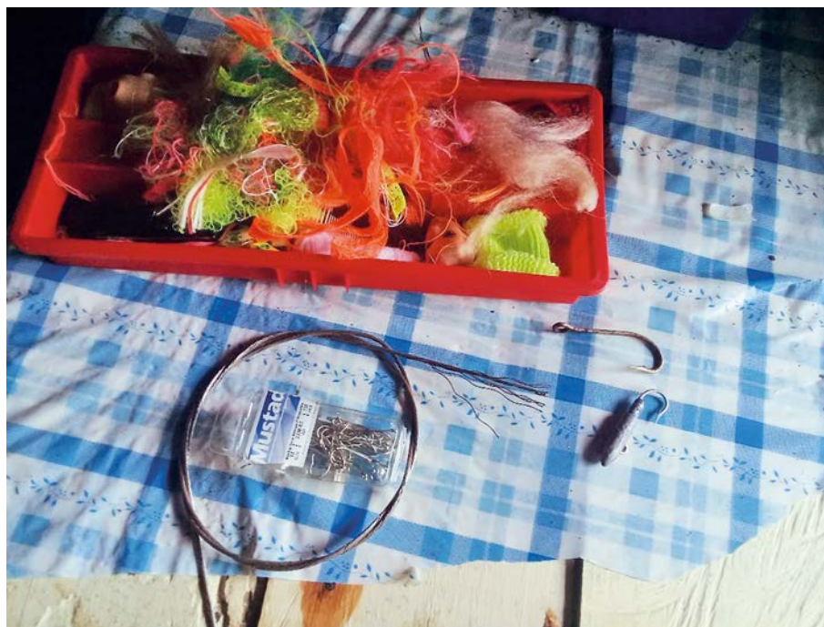
Figura 3. Una pequeña caja de herramientas con objetos para la pesca artesanal.

A las cabezas, decía el viejo, se les van poniendo plumillas con pelo de muñeca, moñas del pelo, cordones, entre otros objetos. Incluso pelucas. Me estaba enseñando su pequeña caja de herramientas. Era roja y contenía un sinnúmero de objetos curiosos y nada suntuosos, pero sentía que traían consigo grandiosas historias. Más aún, cuando vi una cabeza de muñeca dentro de sus objetos y oía gritar por la ventana a sus nietas mientras él me enseñaba con cariño cada uno de sus objetos. Recuerdo que al abrir su pequeña caja de herramientas emergieron muchísimos colores. También vi anzuelos, guayas o "acero", como a él le gusta nombrarlo.