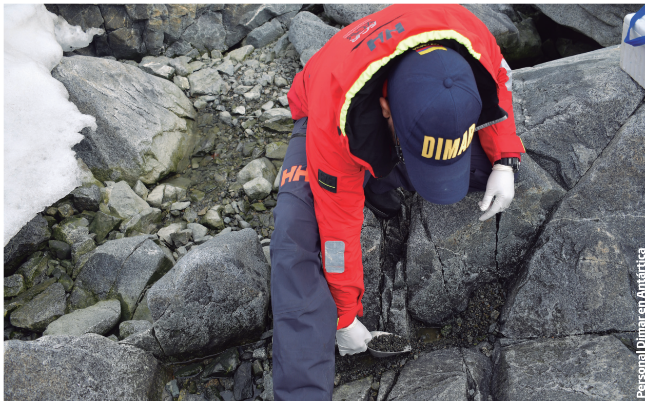
Personal Dimar en Antártica

conservación de la Antártica, y sus ecosistemas asociados. Por su parte, en el orden nacional, el liderazgo de la Dimar ha logrado esfuerzos técnicos, científicos y económicos encaminados a la implementación adecuada del Protocolo de Madrid; en tal sentido, Entidad está comprometida con su aporte al cumplimiento de las obligaciones derivadas de la adhesión de Colombia al Protocolo de Madrid y de su vinculación al Comité de Protección Ambiental (CPA), abarcando temas como las evaluaciones de impacto ambiental, conservación de la flora y la fauna antártica, eliminación y tratamiento de residuos, prevención de la contaminación marina, y protección y gestión de zonas antárticas.