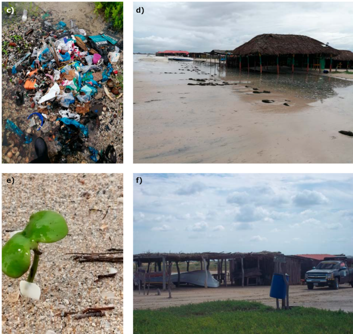
Figura 6. Actividades antrópicas y efectos identificados en el área de playa. Extracción de conchas marinas (a), reducción de la franja costera (b), acumulación de residuos sólidos (c), inundación de infraestructura (d), propágulos de manglar (e) y tránsito de vehículos (f).

Las actividades de rastrillaje manual de la arena, y el tránsito constante de turistas y residentes afectan a los procesos de regeneración natural de los propágulos de manglar (Fig. 6e) e impiden su crecimiento natural; mientras que el tránsito de motos y vehículos (Fig. 6f) ocasiona compactación y pérdida de la cobertura vegetal del suelo. Todo esto sumado a la ausencia de autoridades ambientales e instituciones de gestión del riesgo y desastres.