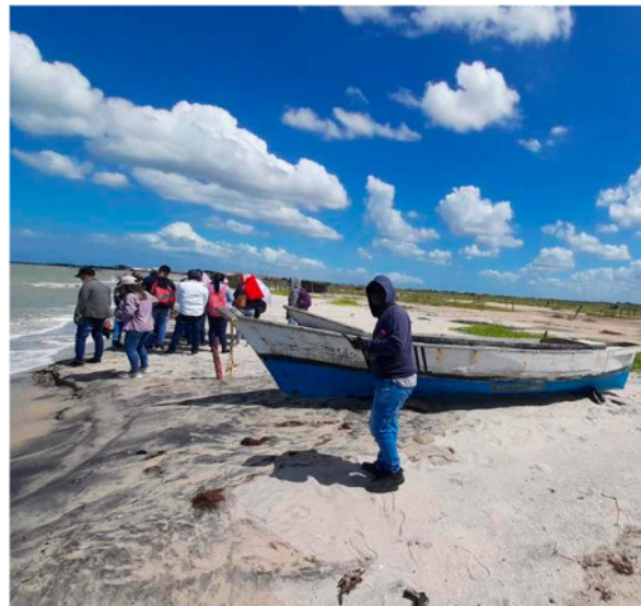
Figura 4. Actividades de observación en campo.

Finalmente y para la determinación de la percepción de los residentes locales sobre las amenazas, se formularon las siguientes preguntas: