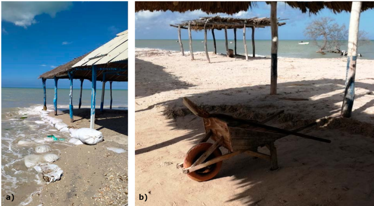
Figura 5. Acciones de manejo por parte de la población local (a) y elementos empleados para transportar arena (b).

Con relación a la pregunta ¿qué medidas se han tomado para mitigar y/o prevenir las amenazas presentes en las playas de Mayapo?, se encontró que para mitigar los efectos de las inundaciones la comunidad local ha implementado como medida la extracción de arena de la misma playa para construir barreras de protección (Fig. 5a) y la utilización de carretillas para transportar arena de la playa (Fig. 5b) y rellenar las vías de acceso inundadas, para así garantizar la entrada de los turistas con sus vehículos; acción que posiblemente pueda estar incrementando el problema por la pérdida de sedimento en el área de playa.