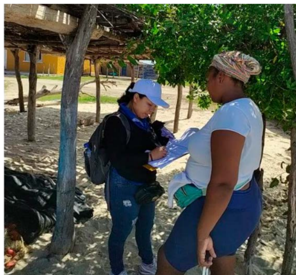
Figura 3. Realización de entrevistas en la zona de estudio.

El trabajo de campo se apoyó con estudiantes del décimo semestre del Programa Ingeniería Ambiental de la Universidad de La Guajira - Sede Fonseca, en curso de la asignatura Énfasis III - Evaluación y gestión de riesgos naturales y antrópicos en áreas marinocostaseras 2022-II (Fig. 4). Para la tabulación de la información se implementó la hoja de cálculo Microsoft Excel para Windows, versión 2016.