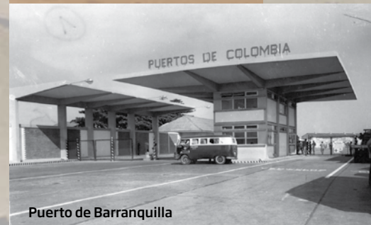
Puerto de Barranquilla

El Presidente de la República, Alfonso López Pumarejo, inaugura las obras realizadas en el canal de acceso al puerto de Barranquilla y las instalaciones del Terminal, el 22 de diciembre.