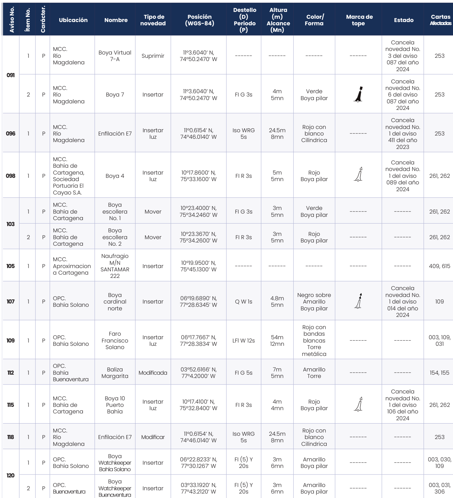
Tabla V. Avisos a los Navegantes permanentes del mes de abril de 2024.