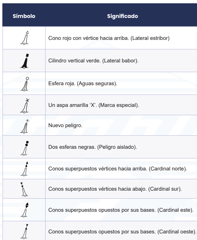
Tabla II. Marcas de tope.